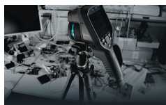
タイムラプス撮影 (E76/E86/E96)