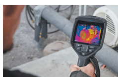
高視野角 高輝度IPS液晶