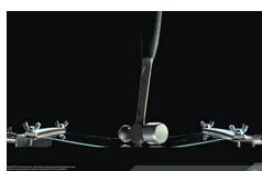
耐衝撃液晶ディスプレイ採用